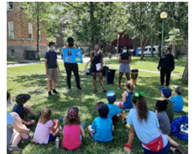
Centre multiethnique : accompagnement aux familles immigrantes