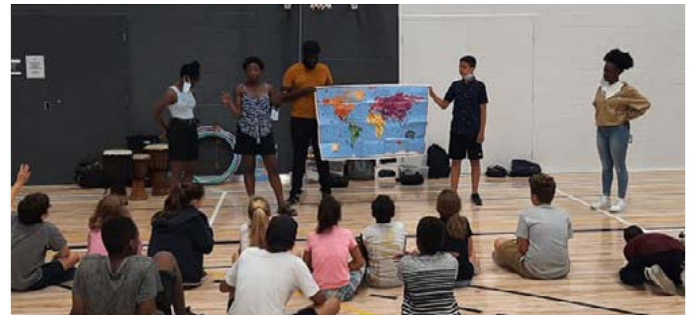
Centre R.I.R.E. 2000 : sensibilisation des jeunes et des moniteurs par le biais des activités estivales